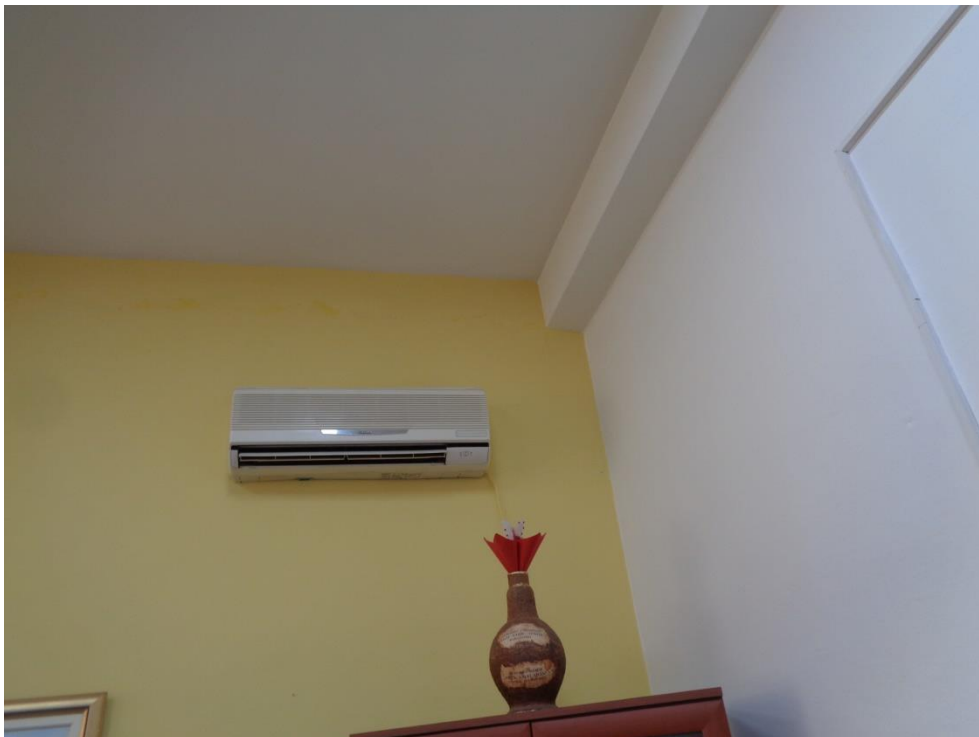
Слика 2.1.2.1 – Приказ на инсталиран микроклиматски уред

Условите во работниот простор се на солидно ниво, кое обезбедува непречено одвивање на работата. Задоволува природното како и вештачкото осветлување а и хигената е на задоволително ниво.