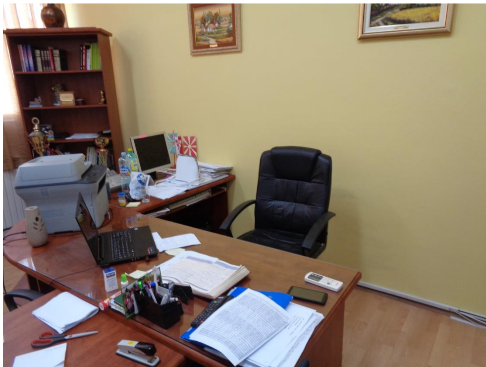
Слика 2.1.2.1.1 – Приказ на работниот простор на помошник директорот

Помошник директорот ги спроведува задолженијата дадени од директорот. Тој има работни задачи кои се од важно значење за функционирање на секојдневните активности. Работи, односно работни задачи од делокругот на директорот, заменување на директорот при негово отсуство. Помошник директорот му помага на директорот во подготвувањето на седниците на Наставничкиот колегиуми во извршувањето на одлуките на Училишниот одбор и другите стручни органи. Пратење на работата и помош на наставниците и другите работници. Непосредно учество во организирањето на соработката со наставниците и родителите на учениците, планирање и организирање формите на таа соработка. Организирање на слободните и воннаставните активности. Координирање на работата на одделенските раководители, одделенските совети и стручните активи. Грижа за употребата и обезбедувањето на наставните средства и опремата. Врши и други работи определени со закон и актите на училиштето.