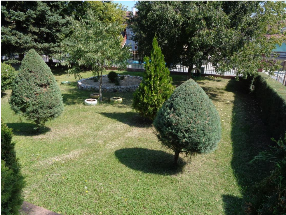
Слика 2.2.2.1.1 - Приказ на дел од работниот простор на одржувач на парк и зеленило